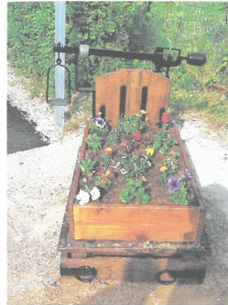
El balance à coehons

Pas bien loin de là les visiteurs découvriront également une ancienne balance de ferme. Incontournable, ce matériel servait à peser les animaux, les sacs de grain, de pommes et bien plus.