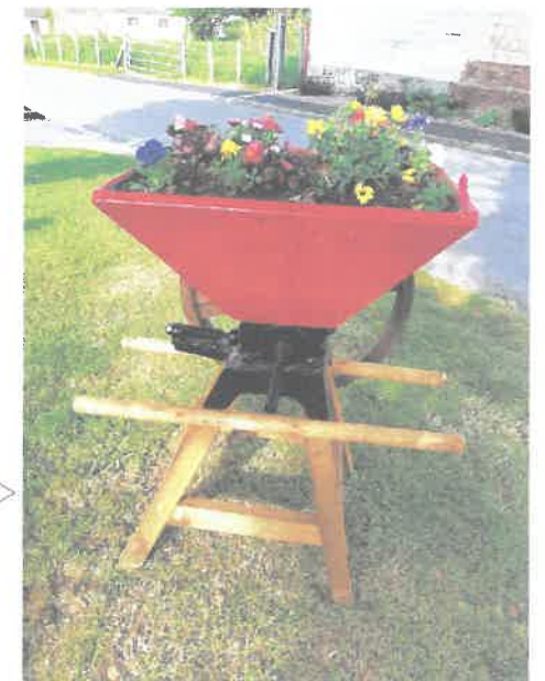
Ch' grugeouér à peumes