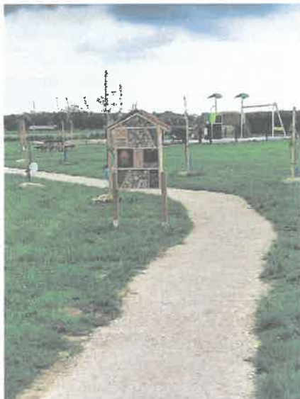
Aire de jeux