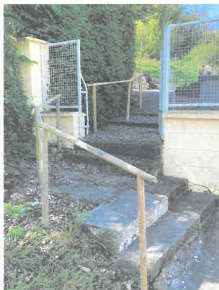
Cimetière de Saint-Pierre-à-Gouy

Pour faciliter les accès piétons des cimetières et de l'aire de jeux, des travaux de remblaiement et mise en sécurité ont été réalisés dernièrement.