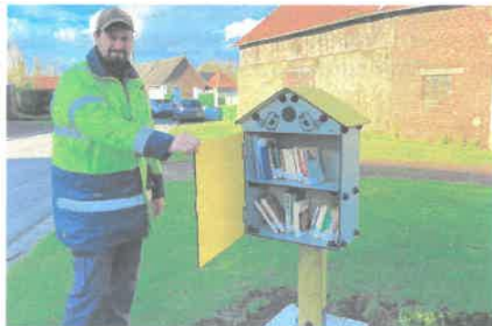
Boîte à lire sur la place du village, à Crouy