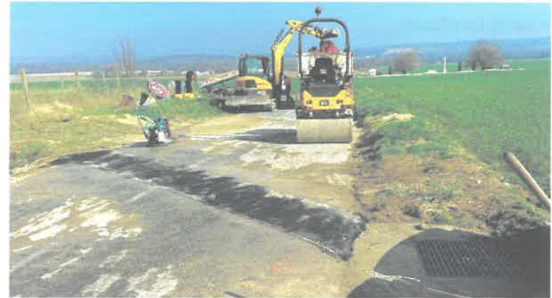
Travaux permettant de faciliter l'écoulement des eaux pluviales dans le bassin de rétention, chemin de Cavillon RD95