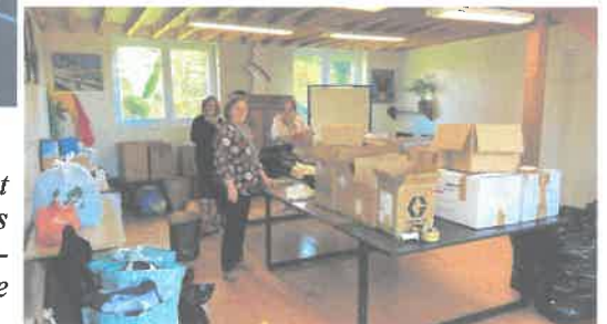
Merci à toutes celles et ceux qui ont contribué à collecter rapidement des produits de première nécessité au profit de la population de l'Ukraine