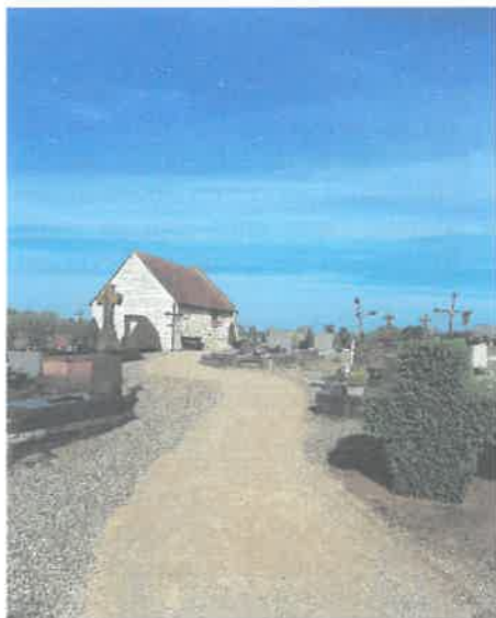
Cimetière de Crouy