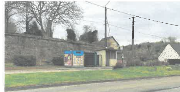
Déplacement des containers de recyclage à Saint-Pierre-à-Gouy