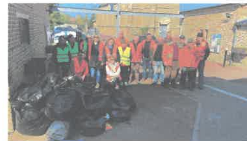
Opération « Hauts-de-France propres »